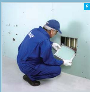
۴ نصب قاب درب دریچه

نصب این دریچه ها بسیار آسان بوده و مطابق مراحل زیر صورت می گیرد*: