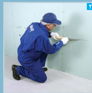
۲ برش پنل به ابعاد مورد نظر