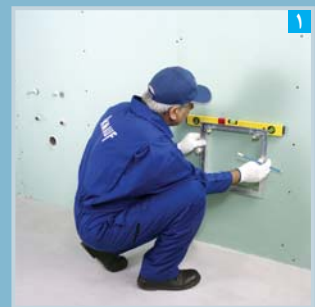
۱ علامت گذاری محل نصب دریچه (با استفاده از قاب دریچه)